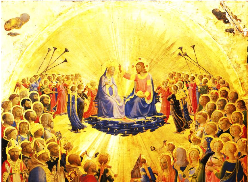
Fra Angelico. Die Krönung Marias.

Die Einweihung der Seele als religiöse Bestimmung der Menschheit