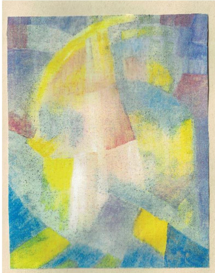
Der Angriff auf die Bestimmung des Menschen